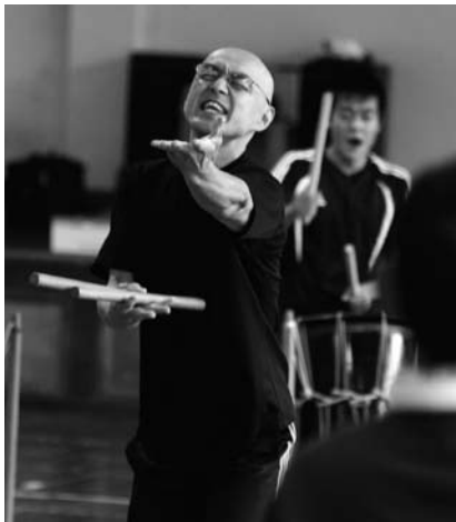
鼓童塾の合い言葉は「熱き思ひ」!