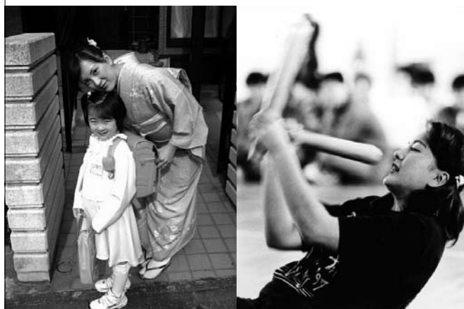
家庭に仕事に大忙しの2児のステキなお母さん。娘さんの入学式にて。

冷たい風が吹き、赤く染まった木の葉が散りゆく季節。私にとって十三度目の、佐渡の冬を迎えようとしています。 この原稿の依頼を受け思い返してみますと、高校を卒業後すぐに入所した私は、学生気分が抜けないまま我儘な時間を過ごし、同期に迷惑をかけていたと反省をします。それと同時に「学び直したい」「ご教わりしたい」ことが数多くあり、あの場所あの時に戻ってみたいと感じます。 私は卒業後、実家に戻ることなく佐渡に住みつき、十年以上の時が流れました。 現在私は、佐渡島内の葬儀社に勤め、主に司会進行の仕事をしています。最愛なる故人様との最後のお別れするとき。そのときをお手伝いさせていただいていますと、音楽の世界と同じように『心で伝