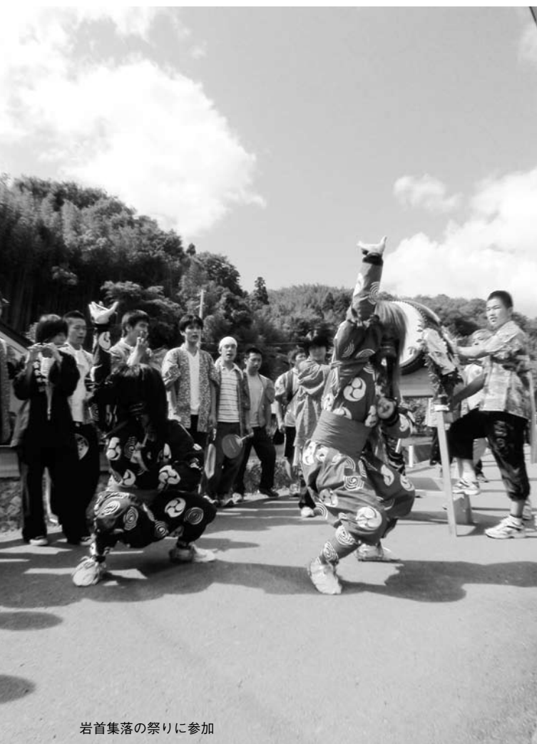
岩首集落の祭りに参加