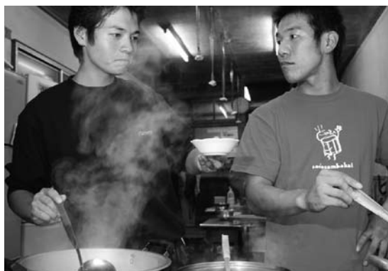
「これ、味無くねえ?」 「えっ、そんなことないだろ。」 もう、配膳の時間なんですけど…。

見て、俺は自身自身の素直さに向き合うことができたかな。自分の思ったこと、言いたいことを以前より素直に口に出せるようになって、