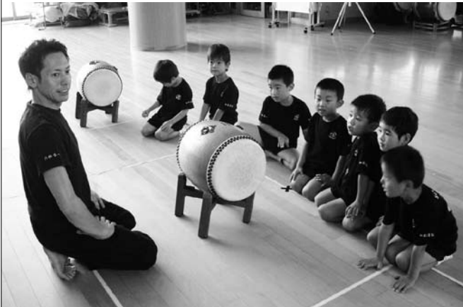
園児へ熱心に和太鼓の練習に取り組む、朝田幼稚園の園長先生。

私は現在、静岡県浜松市内の幼稚園や保育園の仕事、また、大学や専門学校にて講師を担当するかわら、子どもから大人までの太鼓グループを立ち上げる（鼓童メンバーのご指導にも助けられています）など、やりがいのある仕事に汗しておられます。鼓童の活動理念の一つである「くらす・まなぶ・つくる」という基礎は、幼児期の現場にも通じていると実感いたします。 さて、研修所に最年長（当時、三八歳）で人所させていただきましたが、当時、相当な決断で臨んだ事を思い出します。その、決断とは、何か断つ事を決めることですか。いま、一歩引いて想えば、鼓童の膝元で学