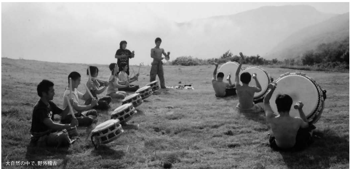
大自然の中で、野外稽古