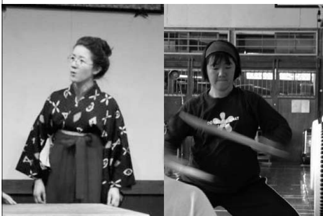
舞台「見よ、飛行機の高く飛べるを」で初江役を演じて。(劇団CANプロ/2007)

私は現在、舞台役者をやっています。役者を目指す途中で研修所と出会いました。自分への糧の為にどうしても行きたかった研修所では、泣き虫で、甘えん坊で…一年で離れる結果になりましたが、現在、役者として舞台上に立っているのも研修所時代があったからこそです。 連日徹夜同然で舞台の小道具を作っていると「どうしてそこまでがんばれるの?」と聞かれます。もちろん「好き」だからですが、研修所での様々な経験が、苦しい時には何度も何度も自分を奮い立たせてくれました。 劇団の旗揚げから七年。変動の時を迎えています。乗り越える為に欠けているのが信頼関係だと感じています。