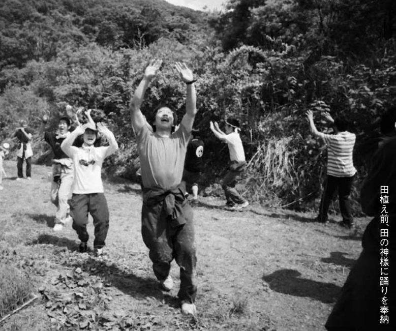
田植え前、田の神様に踊りを奉納